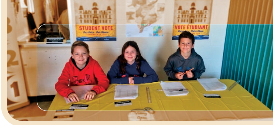
Les élèves d'une école intermédiaire du Nouveau-Brunswick participent au programme national Vote étudiant.