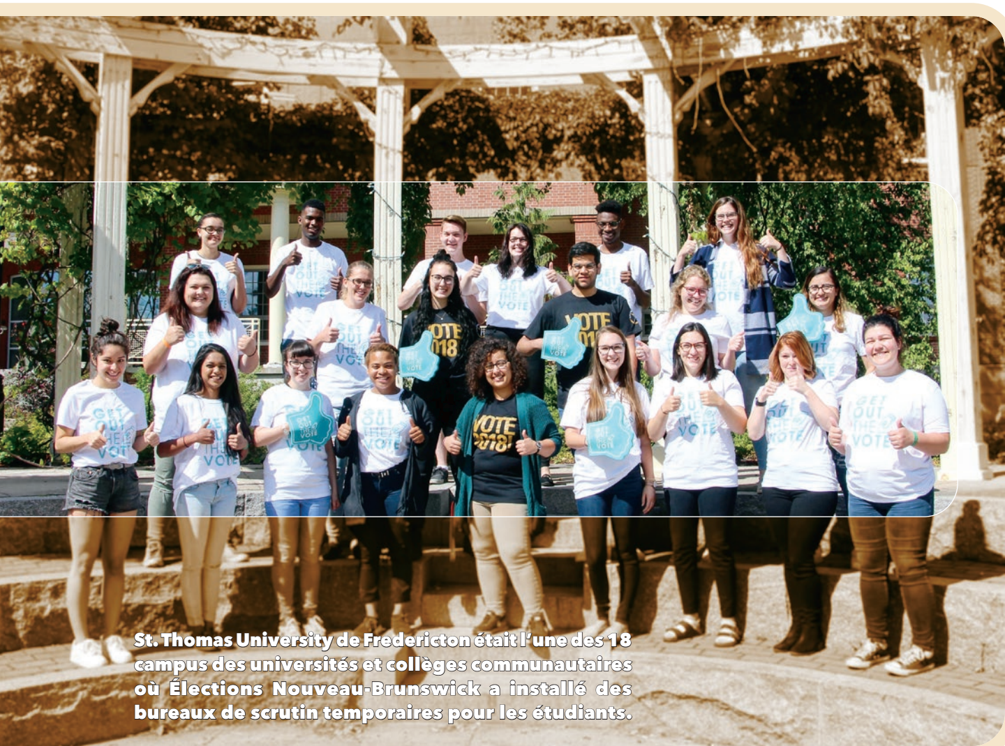
St. Thomas University de Fredericton était l'une des 18 campus des universités et collèges communautaires où Élections Nouveau-Brunswick a installé des bureaux de scrutin temporaires pour les étudiants.